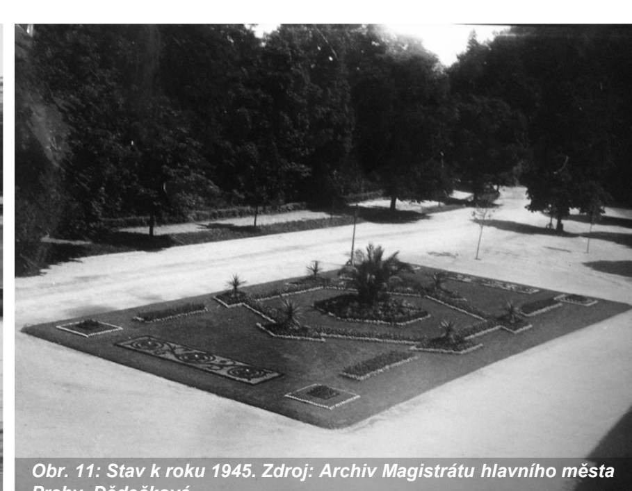
Obr. 11: Stav k roku 1945.