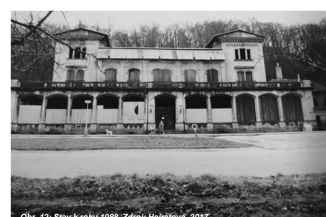
Obr. 12: Stav k roku 1988.