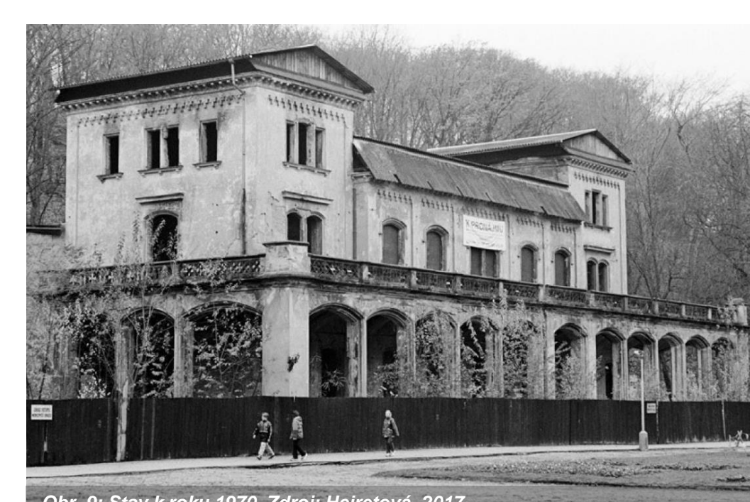
Obr. 9: Stav k roku 1970.