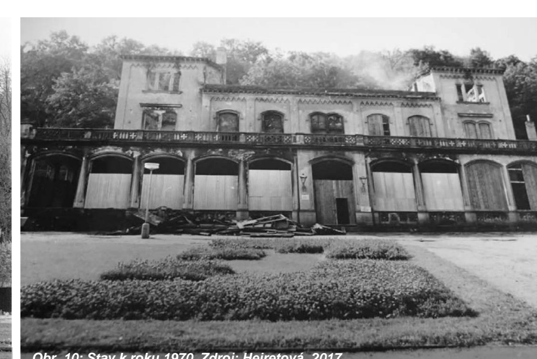
Obr. 10: Stav k roku 1970.